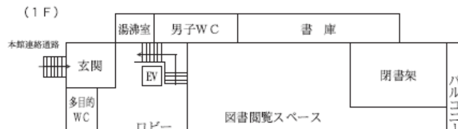
図書館（逸外記念館 H27年10月耐震改修竣工）